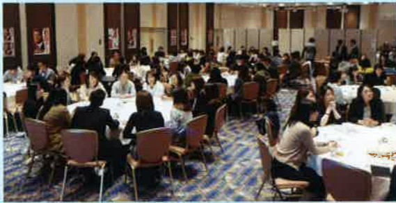
和気藹々のグループワーク