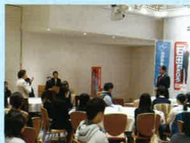
看護の原点からズレない政策に感動