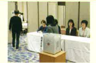
投票立会人ガシロ貝