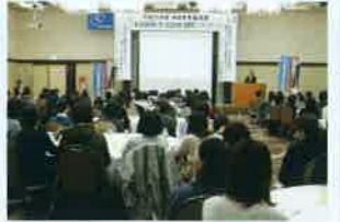
投票事情よく分かりました

2019年は「平成が終わる」「東京オリンピックの前年」「ラグビーW杯の開催」「消費税が8%から10%にアップ」「統一地方選挙と参議院選挙が行われる」イベントの多い年である。統一選は4年毎(4月)、参院選は3年毎(7月)の12年に一度の亥年に行われる。ほぼ連続した選挙では支持団体も個人も疲れ、参院選への投票率が下がる。これが「亥年現象」と言われるもので、増して増税の年は与党が不利である。 今回の選挙制度改正で政党が名簿順位に拘束枠をつけることが可能となったため、比例代表の組織内候補者は当選が厳しくなる可能性があり、各組織は前回の参院選以上の努力が必要になる。投票弱者の投票環境向上に向けた取り組み、交通弱者対策、投票日当日の『共通投票所』の設置への働きかけなど、声に出してアクションを起こす、自分たちの目標だけでなく、地域社会のインフルエンサーにならないと教えられた。（記 工藤）