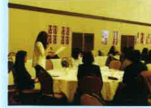
リーダーとしての行動表明する発表者