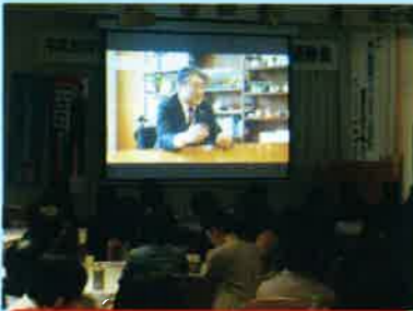
DVD 『いい看護の答えは現場にある』