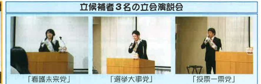
立候補者3名の立会演説会