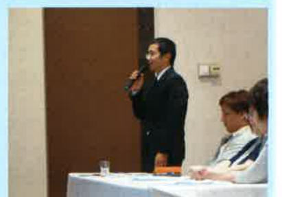
参加型研修会 “麻生クン立派”