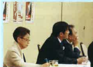
初めて聞いたわ『亥年現象』

2019年は「平成が終わる」「東京オリンピックの前年」「ラグビーW杯の開催」「消費税が8%から10%にアップ」「統一地方選挙と参議院選挙が行われる」イベントの多い年である。統一選は4年毎(4月)、参院選は3年毎(7月)の12年に一度の亥年に行われる。ほぼ連続した選挙では支持団体も個人も疲れ、参院選への投票率が下がる。これが「亥年現象」と言われるもので、増して増税の年は与党が不利である。 今回の選挙制度改正で政党が名簿順位に拘束枠をつけることが可能となったため、比例代表の組織内候補者は当選が厳しくなる可能性があり、各組織は前回の参院選以上の努力が必要になる。投票弱者の投票環境向上に向けた取り組み、交通弱者対策、投票日当日の『共通投票所』の設置への働きかけなど、声に出してアクションを起こす、自分たちの目標だけでなく、地域社会のインフルエンサーにならないと教えられた。（記 工藤）