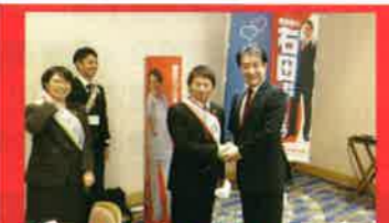
当選おめでとうございます