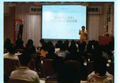
説得力あり、ユーモアあり