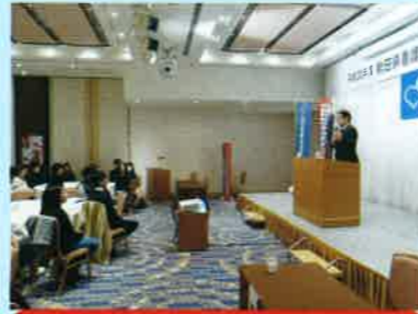
『1000回言い続けると想いは叶う』

＜感想・アンケートより＞ 看護業務の実際からの意見は目からウロコでした。病院での枠でなく、普段の生活リズムを重視すると視点が変わると感じる事ができた。大変参考になった。（40歳代） 先生の看護の本質や深さが伝わる貴重なお話、聞いて良かったです。看護必要度の記録を含めたお話、期待しております。看護師が患者さんの幸せを追求できる時間をもっと持てるようお願いします。（40歳代） やらなければではなく、やらなくてもいいこともあるのでは。おかしいんじゃないの？という思いも大事なんだと思いました。おかしいと思いつつもやり続けていることもたくさんあります。（40歳代） 根本的なことの見直し・考え方をくれた。Ns.だけでなく、患者さんがハッピーでなければ良い改革ではないんだと、あらためて感じた。先生に期待すると共に応援します。（60歳代） 看護現場の声と改善策を政策転換するという流れと、何を切り、何を残し、何ができないかをはっきりさせることが、今考えていくべき事と理解した。（60歳代） 今後日本の医療・看護が目指すべき方向性がよく分かった。看護の原点からズレない政策に感動。（70歳代）