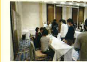
受付（今回入場券は名札）