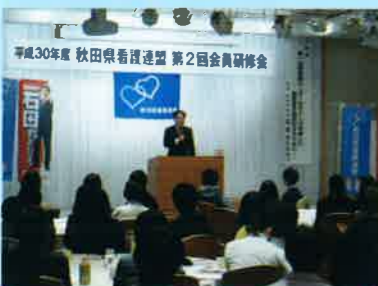
『医療とは患者が幸せになる事』

＜報告＞ 7月29日に開催した第1回支部長・施設幹事・リーダーセミナーでは、13の要望書が出され、これらの『要望書を具現化するために』を以下のように述べられた。（一部抜粋） ① 看護師の事務作業軽減について 看護師の配置は20年前より倍以上に増えてはいるが、忙しいのが現状である。それは、事務作業の多さにある。看護師は事務作業を得意としない。2年後の診療報酬改定では病棟クラークの点数化実現を考えている。 ② 必要度に関する記録について 看護必要度のB項目は看護の評価なので無くせないが、現行の記録については見直しが必要、チェックだけで良い。そしてB項目の点数が下がったこと、つまりは日常生活の自立度が上がったものに加算をつける。 病気を治す事は手段にすぎず、人の幸せを取り戻し、より幸せになる事が医療の目的である。限られた時間の中で、なにをやり、何を残すか。ベッドサイドに行ける時間を充実させ、良い看護ができた実感できるために行動する。患者のために考え方や仕組みを変えていきたい。石田氏の発言はいつも「目から鱗」。そして、語られるのはいつも「患者のしあわせと看護職のしあわせ」である。（記 草薙）